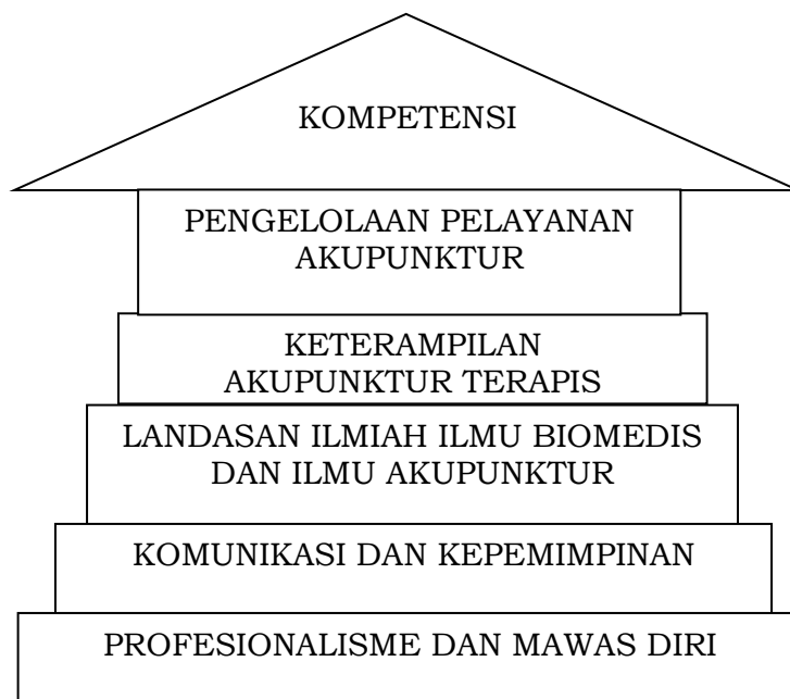
Gambar 3.1 Area Kompetensi Akupunktur Terapis

Lima area kompetensi tersebut dapat digambarkan dalam hubungan komponen seperti bangunan di bawah ini: